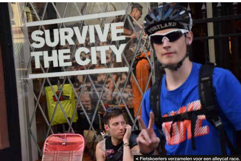
< Fietskoeriers verzamelen voor een alleycat race.

www.travelportland.com www.bikeportland.org www.traveloregon.com ■