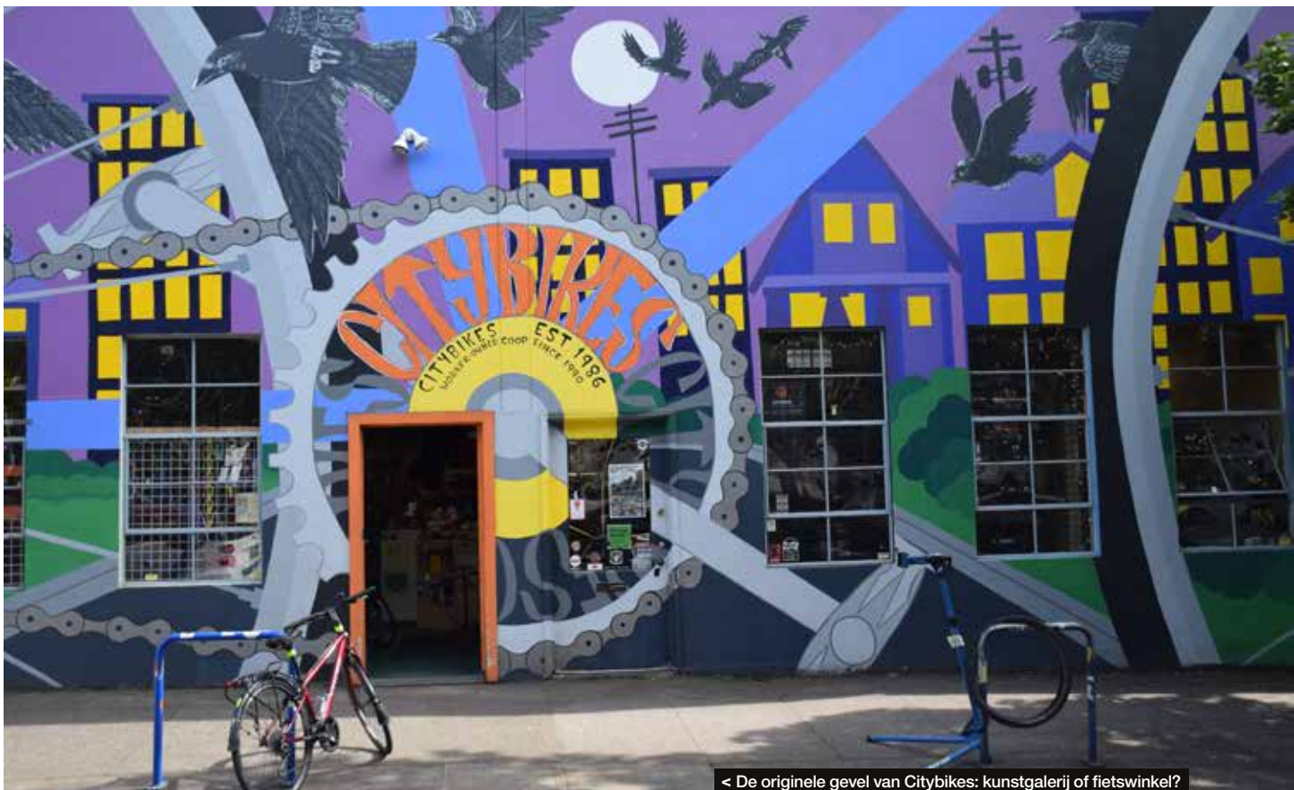
< De originele gevel van Citybikes: kunstgalerij of fietswinkel?