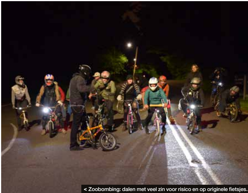
< Zoobombing: dalen met veel zin voor risico en op originele fietsjes.

de creaties van Nutcase Helmets ook in België op de markt zijn. “In tien jaar tijd hebben we met onze sporthelmen al voor veel enthousiasme en plezier gezorgd”, legt Morrow uit. “De meeste helmen die je in de handel vindt, zijn veeleer saai of er staan kinderachtige motieven op. Wij maken onze helmen voor ons zelf, onze kinderen en onze vrienden. Elke helm heeft een origineel en cool ontwerp, waarmee je als fietser of skater de straat op wil.”