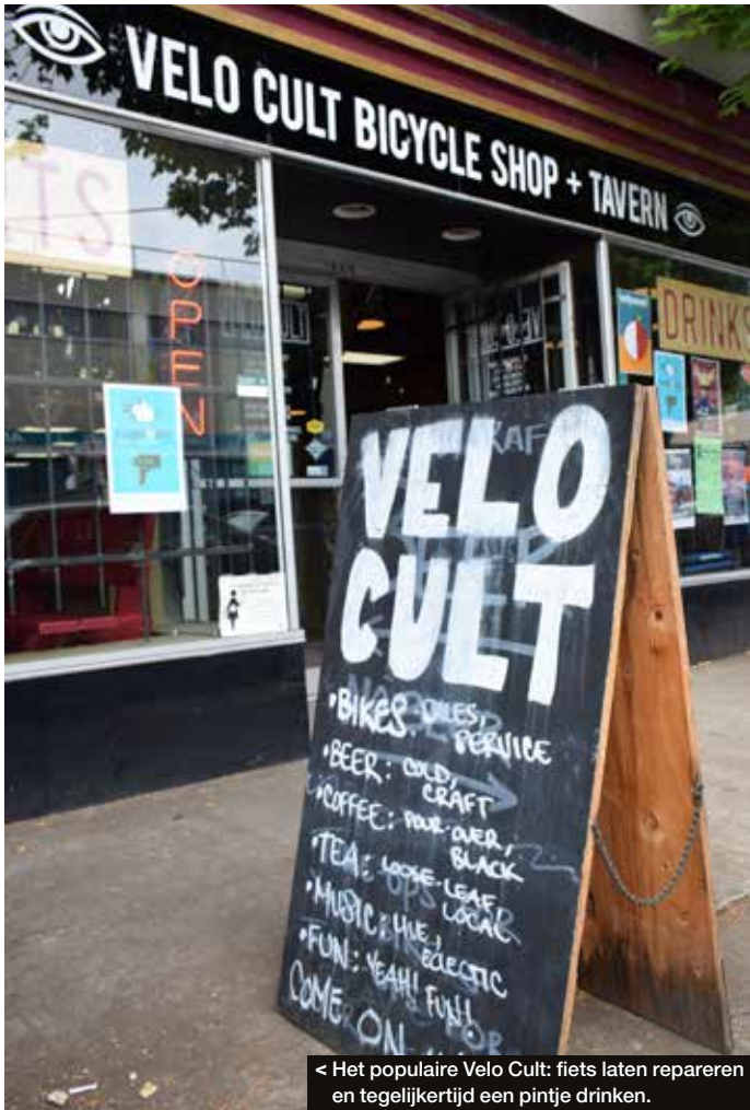
< Het populaire Velo Cult: fiets laten repareren en tegelijkertijd een pintje drinken.