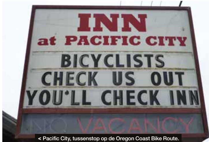
< Pacific City, tussenstop op de Oregon Coast Bike Route.